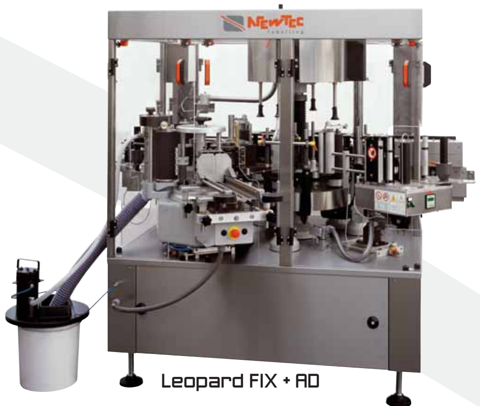
Leopard FIX + RD